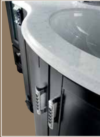
Zar < pag.02