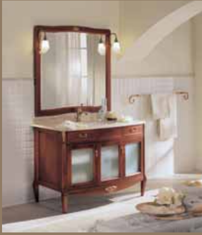
l.117 p.61 h.200