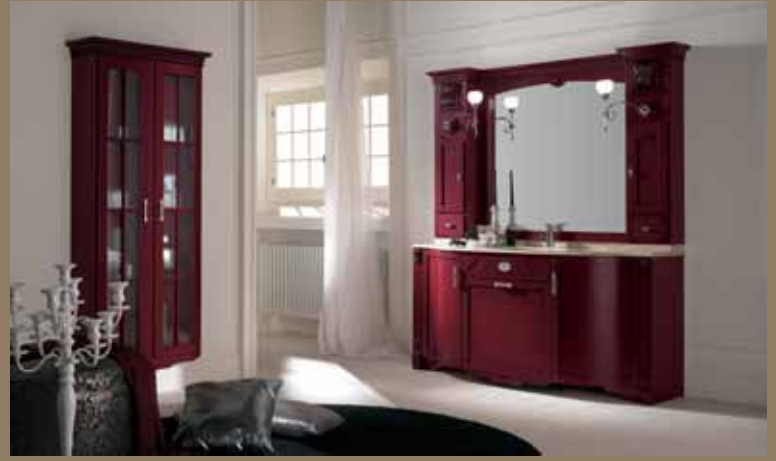
l.171 p.59 h.201 l.80 p.27 h.176 cod.224 cod.224