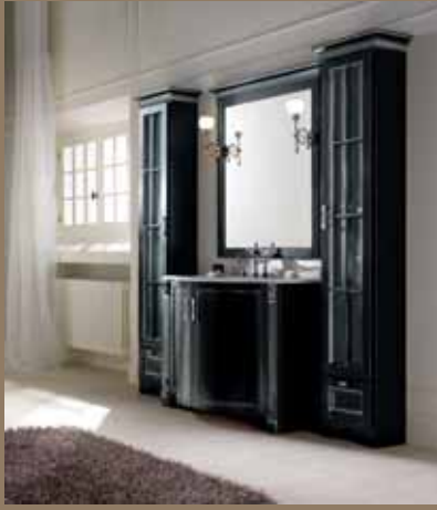
l.44+108+44 p.59 h.205 cod.225