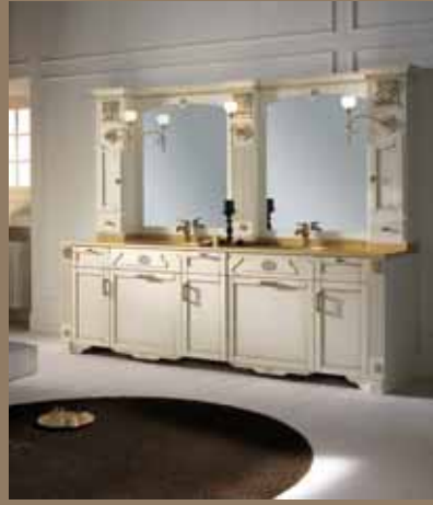
l.257 p.59 h.201 cod.226