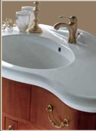
Elisabeth < pag.24