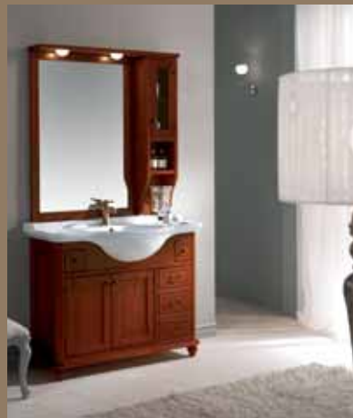
l.106 p.56 h.200