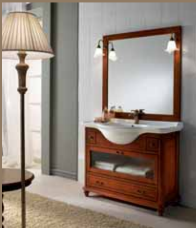
l.106 p.56 h.200