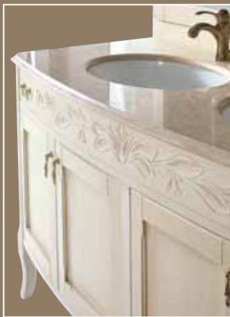
Lord < pag.36