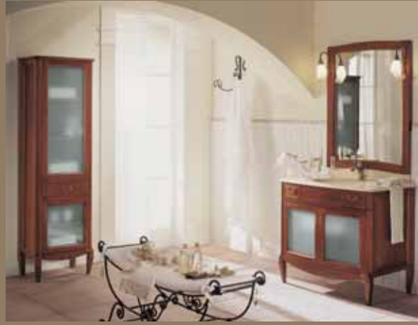
l.92 p.61 h.200 l.53 p.37 h.170