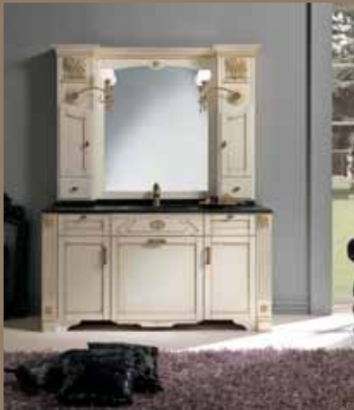
l.158 p.59 h.201 cod.226