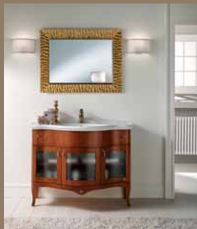
l.109 p.61 h.200 cod.035