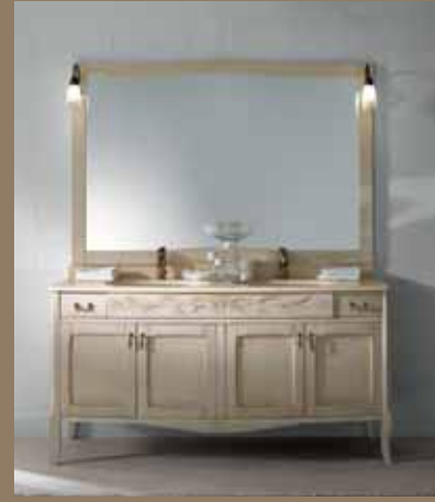
l.159 p.62 h.200