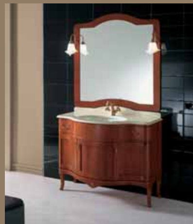
l.105 p.59 h.205 cod.035