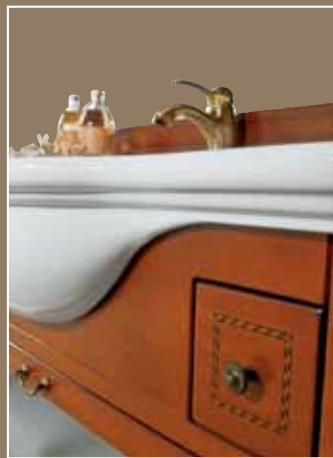
Sir < pag.50