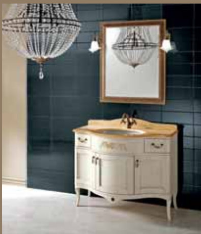
l.105 p.59 h.200 cod.219